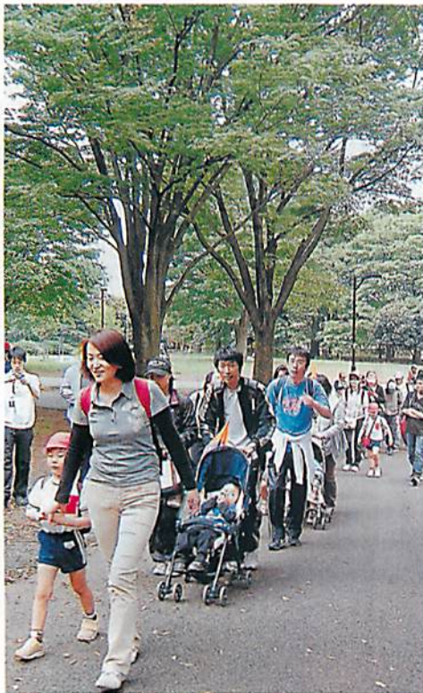
幼稚園の行事として参加する子どもたちもいる —昨年5月、東京都小金井市

主要ルートは大まか3方向に分かれる。 小金井市の中会場からの南東へ向って多摩川方面を回る「花水木ルート」④北西へ多摩川方面を回る「サクラルート」⑤西へ環状等、市川方面を回る「ケヤキルート」に分かれる。